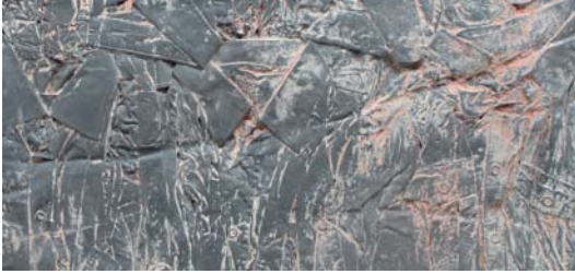
Ausschnitt aus „Formvollendet III“

Formvollendet sind diese Textilcollagen und Rauminstallationen wahrhaftig. Altkleider erfahren durch (Ver-)Formen und Verfremden der Oberflächen eine neue zwei- bzw. dreidimensionale Wertschöpfung.