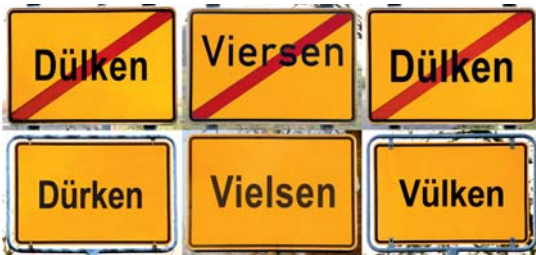
Ausschnitt aus „Eine Reise nach Dülken“

Formvollendet sind diese Textilcollagen und Rauminstallationen wahrhaftig. Altkleider erfahren durch (Ver-)Formen und Verfremden der Oberflächen eine neue zwei- bzw. dreidimensionale Wertschöpfung.